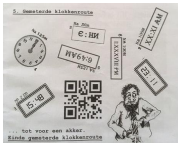
Klokkenroute 2016. Pfff.

Met het laatste kom ik bij de beloofde behandeling van hoe ik vind dat de Wampex anders is geworden sinds onze eerste deelname in 1998. Feit is dat de routes van onze eerste tochten zo'n 10 kilometer korter waren dan nu. Dat we er toch lang over deden was omdat de puzzels meer tijd vroegen om op te lossen. De instinkers waren meedogenlozer, met soms dolen tot gevolg. En het moet gezegd, de kwaliteit van de aanwijzingen was minder dan nu. Het is nu sluitender. Het klopt allemaal. Als je fout loopt weet je zeker dat het aan jezelf ligt. Toen mocht je daaraan nog wel eens twijfelen.