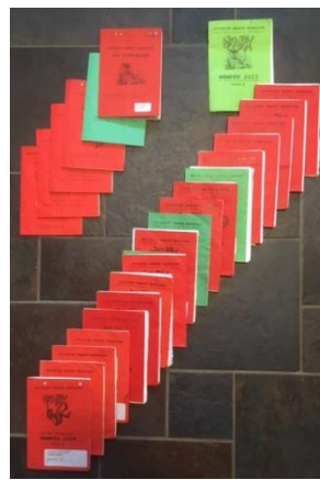
Ik heb alle 25 boekjes nog. Vaak route A.