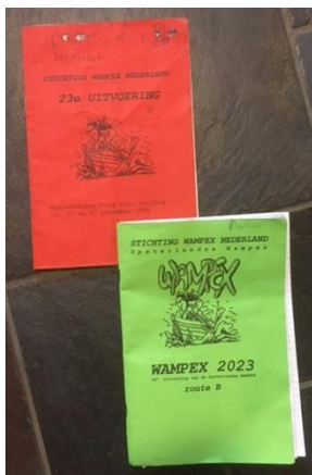
Mijn eerste boekje (1998) en dat van dit jaar.